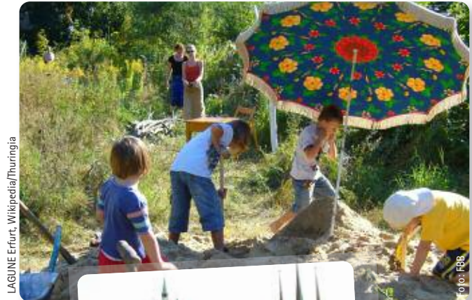
LAGUNE Erfurt

Wir freuen uns auf Ihr Kommen und wünschen Ihnen eine gute Anreise.